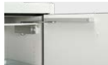
Türschließmechanismus mit Türfeststellung

Die Serie PROline erfüllt die aktuelle Norm DIN EN 14470-1. Sie ist damit noch praxistauglicher und sicherer. Beim Brandkammertest im akkreditierten Prüfinstitut hat dieser Sicherheitsschrank mit über 107 Minuten am Markt die wahrscheinlich höchste Feuerwider-